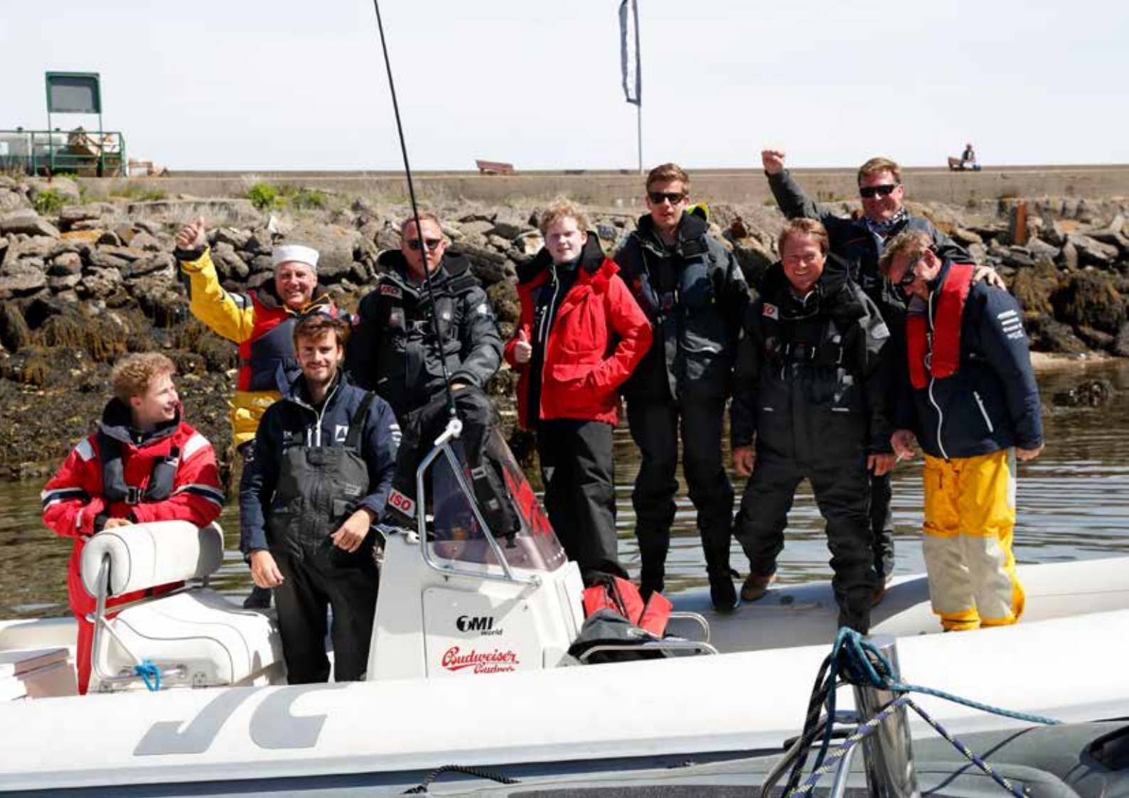
Unser Off-Shore Team