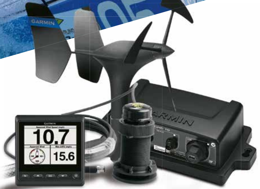
GMI™ 20 BUNDLE