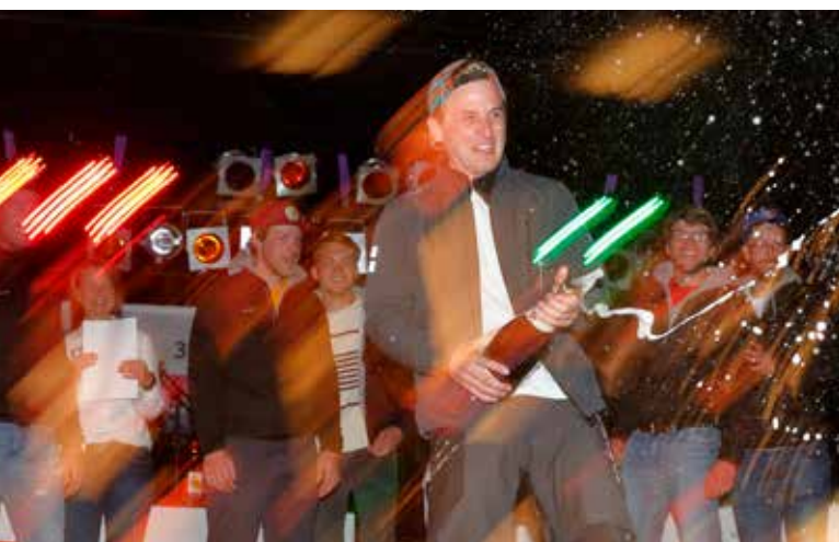
Ausgelassene Stimmung mit anschließender Saalreinigung

The green-red-white colored ribbon of the NORDSEEWOCHEN will be given to the fastest boat of each of the races from the Jade, Weser, Elbe and Hallig Hooge. Next to the trophies for the single regattas, there are more than 26 challenge trophies waiting for the sailors. 9 of the challenge trophies can be won in the feeder races.