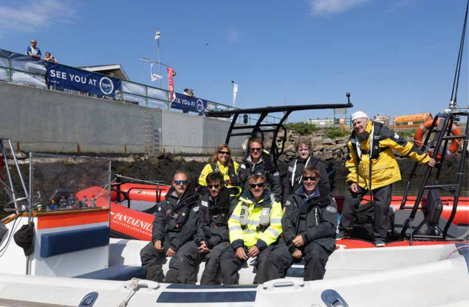
Unser Offshore Team