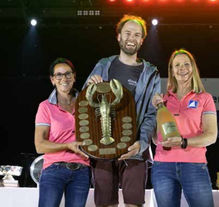
glücklicher Gewinner des Hummer-Cups