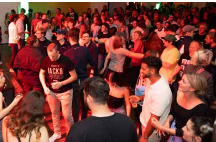
Ausgelassene Stimmung in der Nordseehalle

Next to the trophies for the single regattas, there are more than 26 challenge trophies waiting for the sailors. 9 of the challenge trophies can be won in the feeder races.