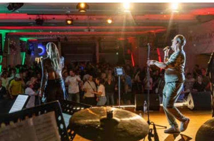
Ausgelassene Stimmung in der Nordseehalle

Next to the trophies for the single regattas, there are more than 25 challenge trophies waiting for the sailors. 9 of the challenge trophies can be won in the feeder races.