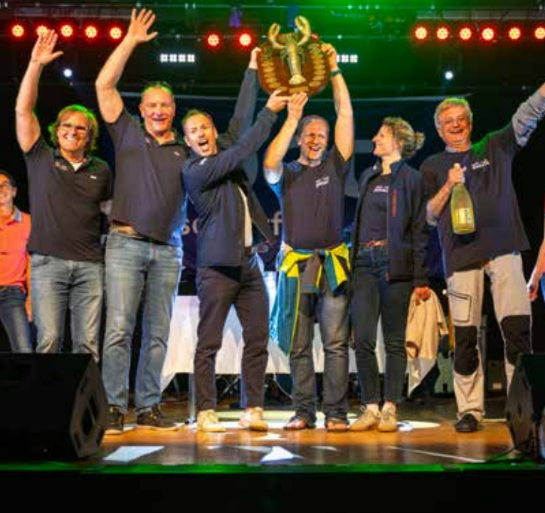
Glückliche Gewinner des Hummer-Cups